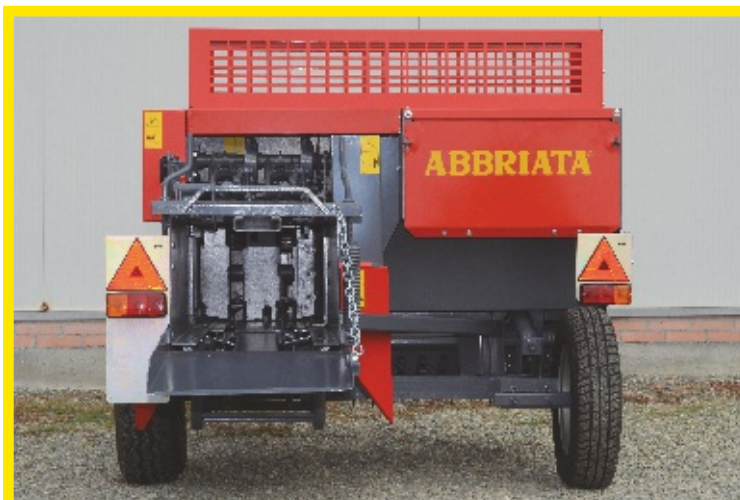
Vista posteriore con ruota montata a tergo raccoglitore Rear view with the side pick-up wheel mounted behind