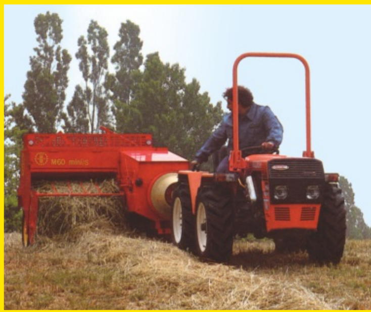
Macchina al lavoro Machine at work