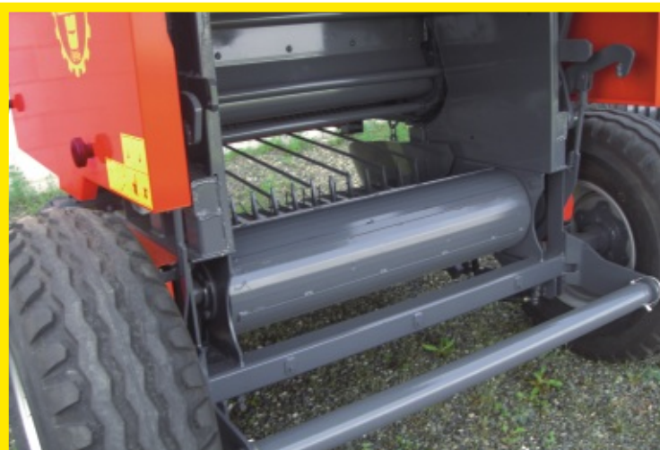
Vista posteriore con allontanatore, rullo, denti infaldatore e catenaria con traversine. Rear view with bale chute, roll, packer device teeth and chain & bars.