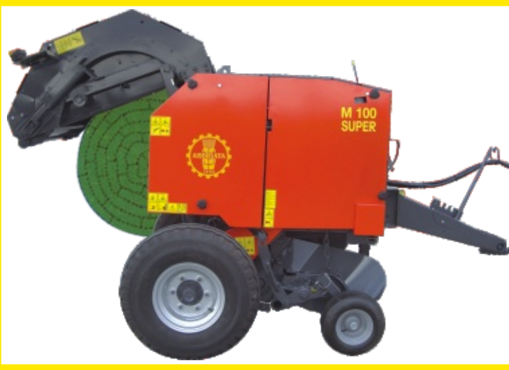
Vista laterale macchina ballone a centro morbido formato in camera fissa a catena e traversine. Lateral view with a sketch of soft center round bale made by fixed chamber with chain and bars.