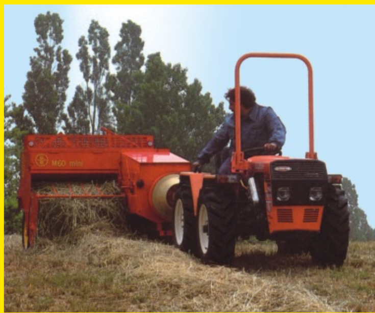
Macchina al lavoro Machine at work