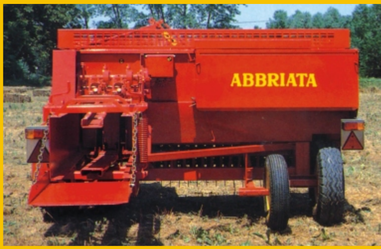
Vista posteriore con III ruota montata Rear view with third wheel mounted